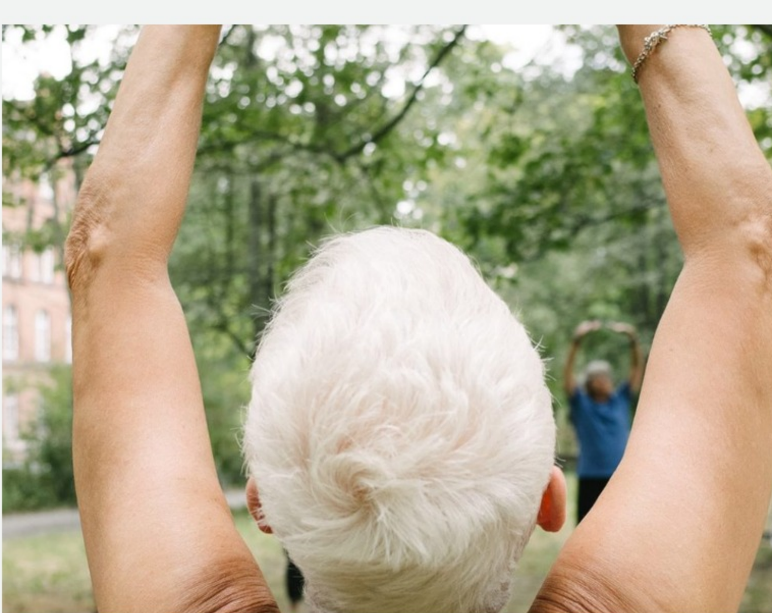
Bewegung im Germaniagarten