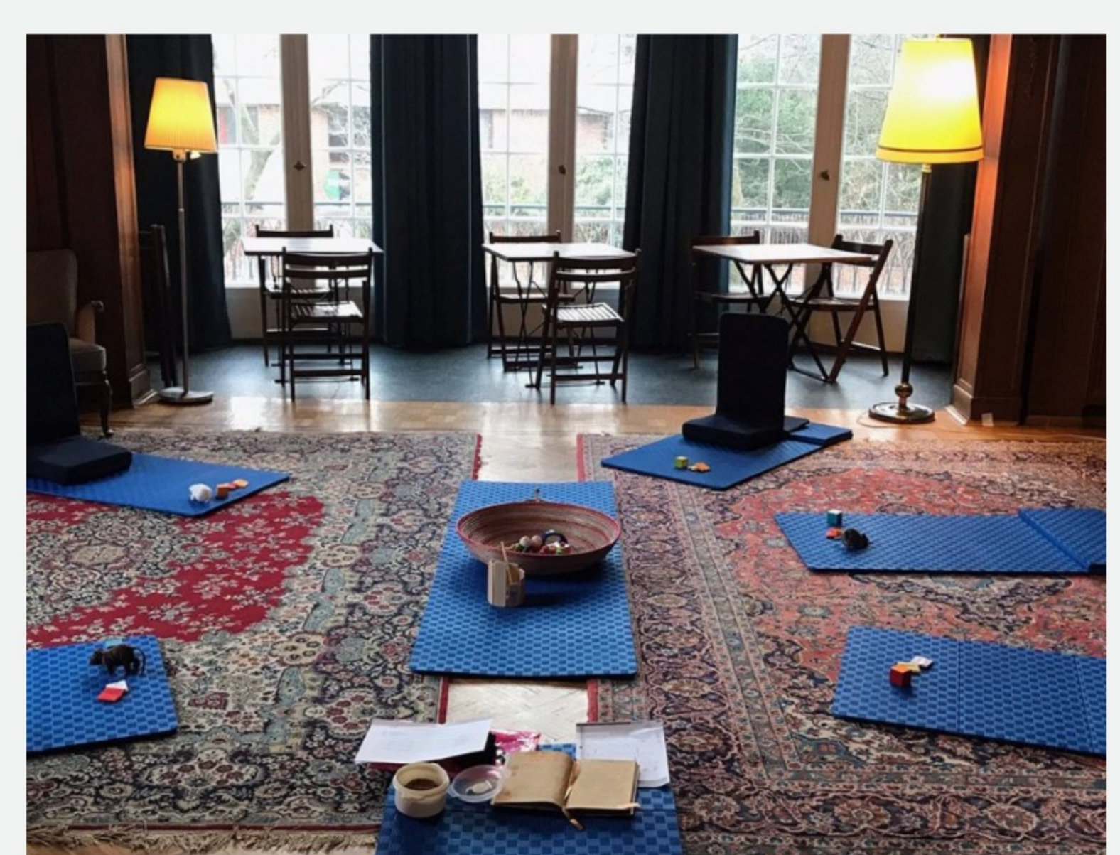
Alltagsnahe Sprachförderung durch Bewegung